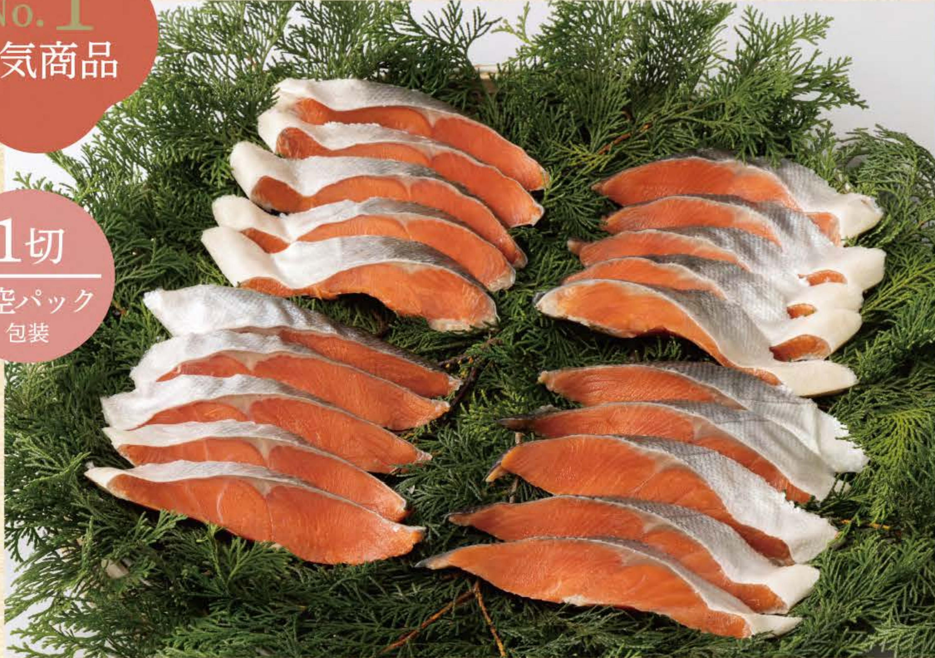
※この写真は 001 の写真です。